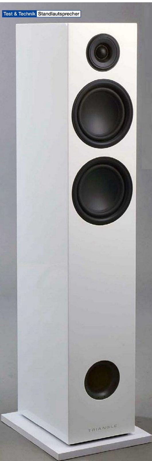
Test & Technik Standlautsprecher