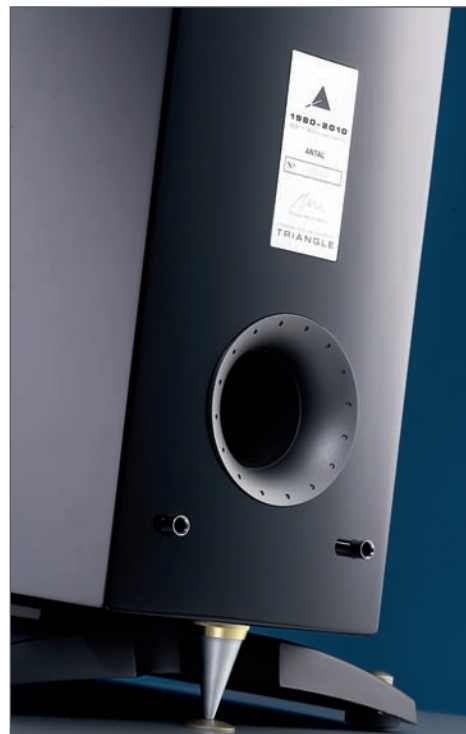
Duży stożek systemu SPEC ma za zadanie „ściągać” wibracje z całej obudowy i odprowadzać je w jednym punkcie styku z podłogą (czysto teoretycznie)