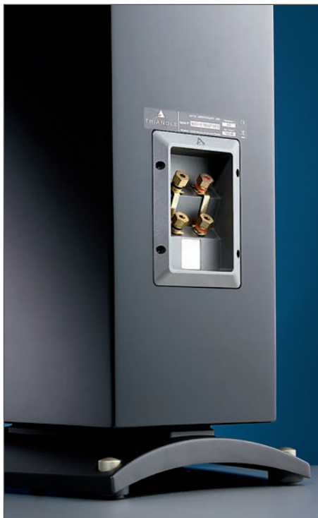
Podstawę wykonano z tworzywa sztucznego dobrej jakości. Zaciski podwójne, takie same jak w zwykłych Antalach Ex

go. Tu zastosowano już bardziej typowe zawieszenie z wklęsłej gumowej fałdy i kosze odlewane z dużymi układami magnetycznymi. Duży otwór bas-refleksu został ustawiony przy podstawie przedniej ścianki, tuż pod plakietką z autografem szefa Triangle'a. Ciekawie wygląda też podstawa. Najważniejszym elementem jest stożek wkręcany przy froncie kolumny, który przejmuje większość parcia na podłogę i odprowadza wibracje do jednego punktu. Stabilność kolumny jest zapewniona przez dodatkowe cztery regulowane stożki. Stosownym kluczem dopasujemy ich wysokość, by kolumna zachowała stabilność.