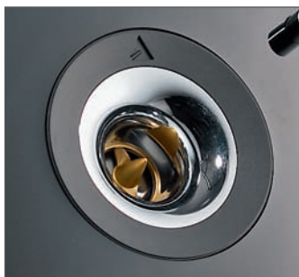
Znak rozpoznawczy Triangle – w tej edycji tubę wykonano z ręcznie polerowanego aluminium

ne, a alikwoty instrumentów smyczkowych – precyzyjnie nakreślone. Nie wydawało mi się też, aby te kolumny były dużo bardziej kierunkowe niż te przeciętne, w których stosuje się tradycyjne kopułki bez tubowego wspomaganie. Warto co prawda zadbać o prawidłowe ustawienie i skierować tweeter w kierunku słuchacza, ale lekkie odchylenie nie będzie dla odsłuchu krytyczne. Bardzo ucieszyła mnie szybkość i klarowność wysokiego skraju pasma, bez uczucia jakiegokolwiek twardości.